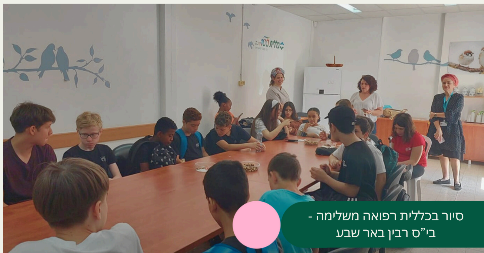
סיור בכללית רפואה משלימה - בי"ס רבין באר שבע

במסגרת פעילות לקידום ולחינוך לבריאות, חשוב לנו גם שבני הנוער ייחשפו לעולמם של צוותי הבריאות, מה שעשוי להקל עליהם בפנייה לקבלת שרות רפואי. בנוסף לכך הירידה במספר הסטודנטים במקצועות הבריאות: רפואה, רוקחות, סיעוד, פיזיותרפיה וקלינאות