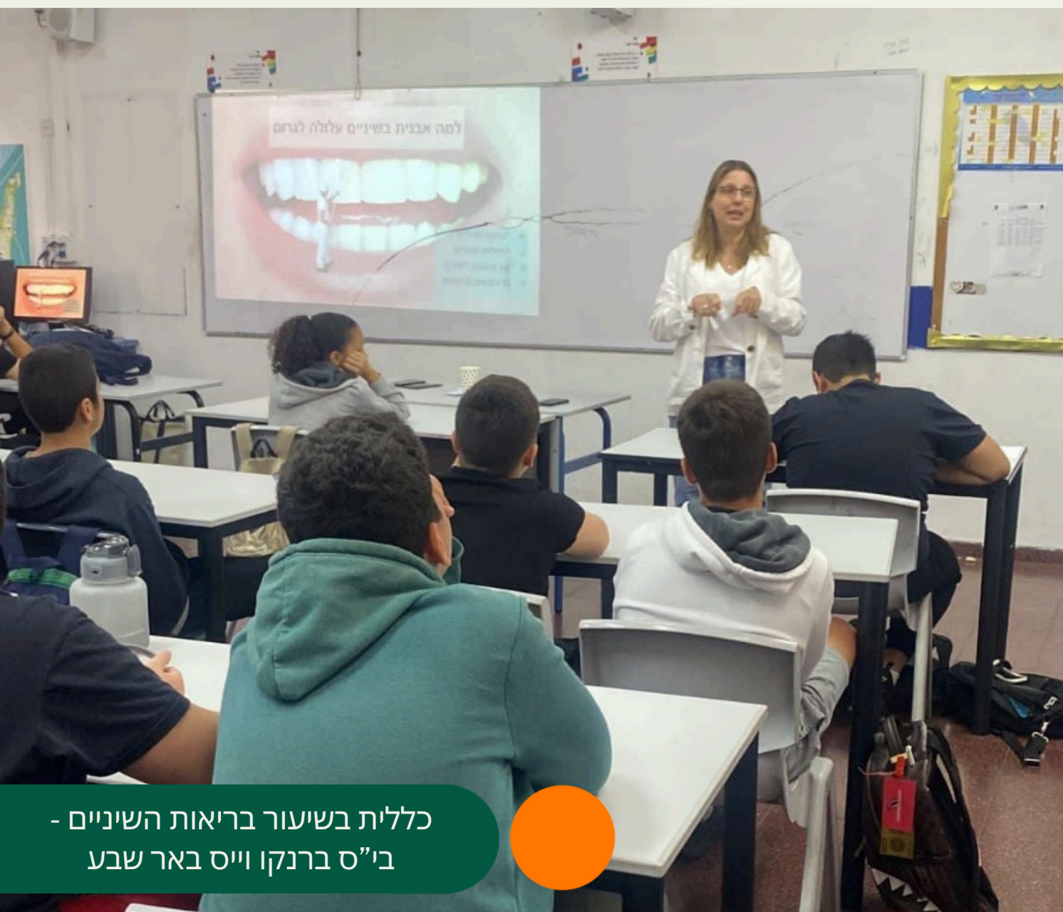
כללית בשיעור בריאות השניים - בי"ס ברנקו וייס באר שבע